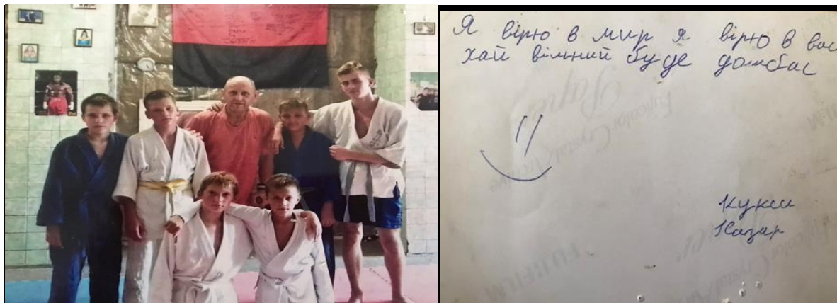
Фото із госпіталя і підпис на зворотній стороні від побратима