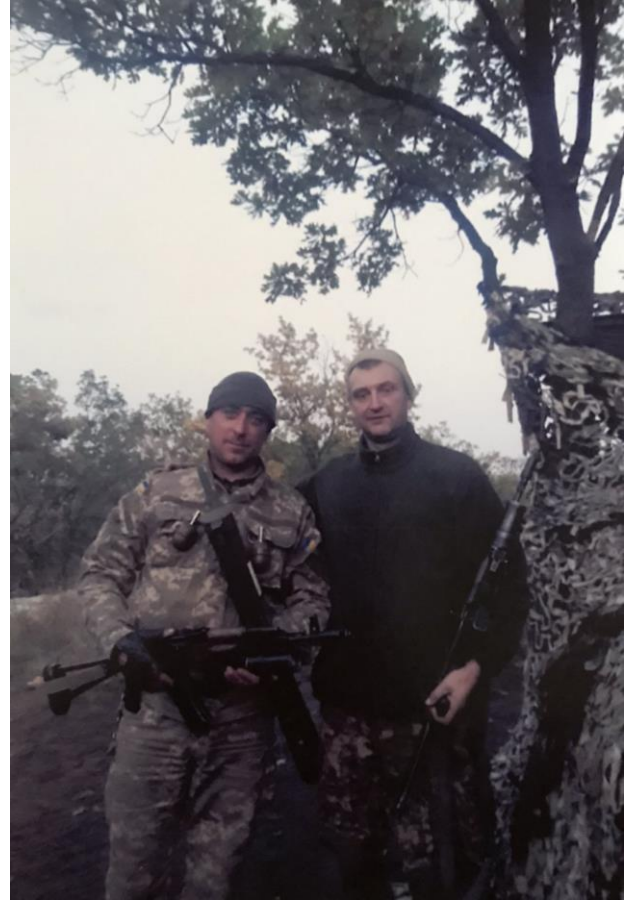
На передовій . Фото з побратимами